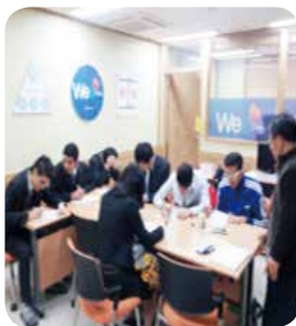
다문화 예비학교 학생 상담