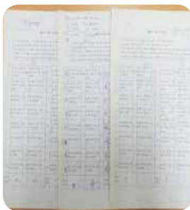
MBTI TEST 결과