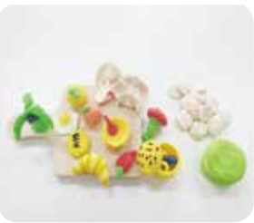
7. 음식 미니어처 만들기