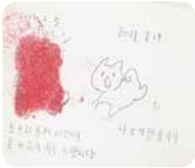
2. 감정 표현하기