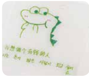
5. 자성예언 열쇠고리