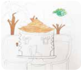
6. 집 설계하기